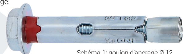
Schéma 1: goujon d'ancrage Ø 12

Si vous souhaitez ranger des objets de valeurs avec une dimension inférieure à 15 mm dans votre coffre-fort, il sera à conseiller de les conserver dans un emballage plus grand, pour avoir plus de sécurité. Ainsi vous éviterez qu'un cambrioleur perce un trou dans le paroi de votre coffre-fort pour voler vos biens avec par exemple un aspirateur.